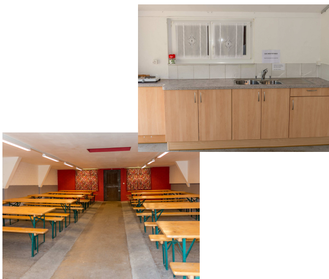
La loge des Golats peut accueillir 80 personnes.