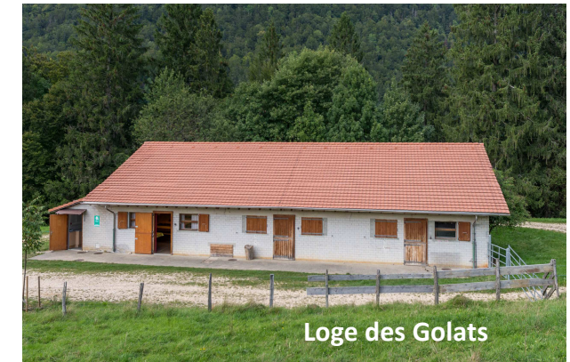
Loge des Golats